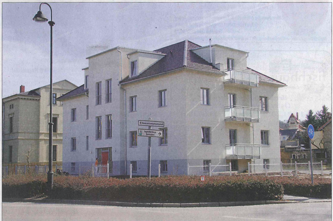
Der Neubau steht genau im Dreieck zwischen Friedensstraße, Bürgergartenstraße und Wenzelsring.